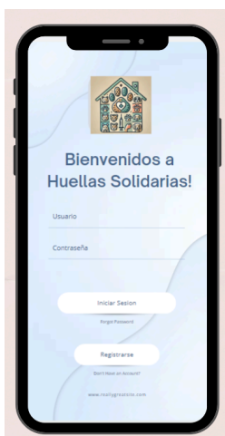
Figura 1. Inicio de la app móvil de Huellas Solidarias

Conoce cómo Huellas Solidarias está revolucionando la forma en que ayudamos a los animales en situación de vulnerabilidad. Esta plataforma (ver Fig. 1 y Fig. 2) conecta a veterinarios, adoptantes, hogares de paso y donadores con animales que necesitan ayuda, creando una comunidad unida por el bienestar animal.